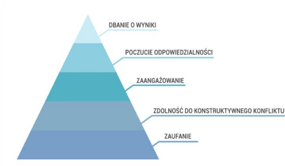
Schemat 2. Etapy budowania zespołów

Źródło: P. LENCIONI, Przezwyciężanie pięciu dysfunkcji pracy zespołowej, Praktyczny przewodnik dla liderów, menedżerów, moderatorów , MT Biznes, Warszawa 2012